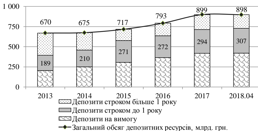
Рис. 1. Розподіл загального обсягу депозитів резидентів України за строками, млрд. грн.

На рис. 1 зобразимо динаміку загального обсягу депозитних ресурсів в Україні за 2013-2018 роки з сегментуванням показника за ознакою строковості розміщених вкладів.